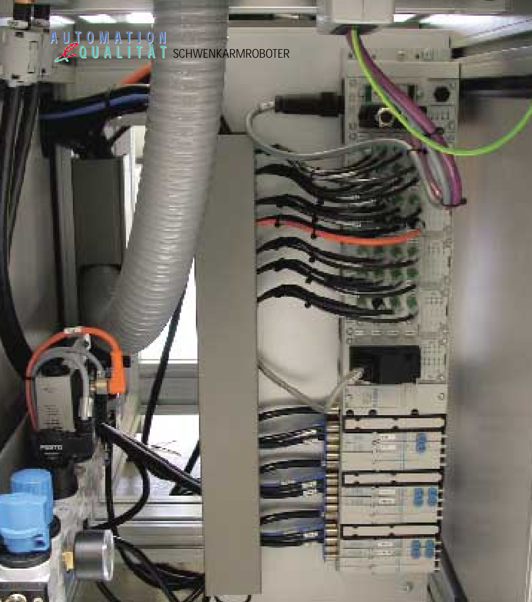
Bauraumoptimiert: Beengte Platzverhältnisse beim Doppelstocker – Die CPX/MPA passen gut in den unteren Bereich der beiden Autostocker.

griertem SCARA-Roboter geeignet. Fünf Autostocker sind beispielsweise in eine Montagelinie integriert, in der Mobiltelefone gefertigt werden. Die Autostocker vereinzeln hier Paletten mit Bauteilen aus einem Stapel und fördern diese in die Montagelinie hinein. Dort entnimmt ein SCARA-Roboter die Bauteile aus den vereinzelt Paletten und setzt sie auf die Werkstückträger auf oder es werden fertige Teile aus der Montagelinie entnommen, in Paletten abgelegt und diese wieder aufgestapelt.